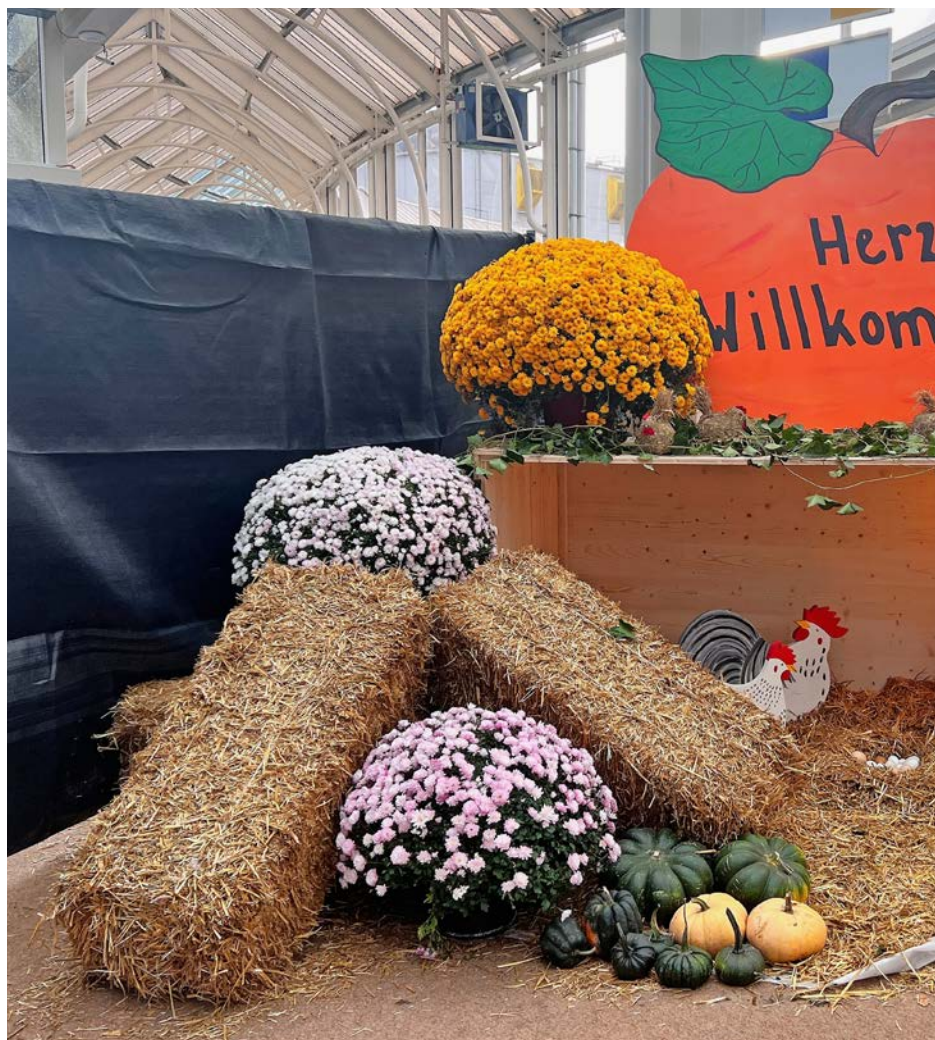
Eingangsbereich an der Hähneschau in Interlaken. Hall d'entrée lors de l'exposition des coqs à Interlaken.

Malheureusement les adeptes du «y'a qu'à» sont dans nos rangs fort nombreux, trop selon moi. Ces remarques et ces attaques parfois blessantes sont démoralisantes et démotivantes. Là où le bât blesse, c'est lorsque l'on demande à ces adeptes du «y'a qu'à» de s'investir et de prendre une charge ou une fonction, il n'y a plus personne. Il serait temps que cela change.