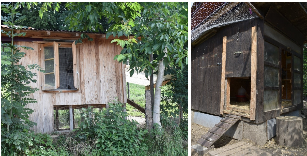
Image 2 : Deux exemples de poulaillers avec de grandes ouvertures pour laisser entrer la lumière et ventiler. L'avant-toit du poulailler de gauche peut être fermé sur les côtés avec du grillage pour en faire un jardin d'hiver. Le parcours extérieur du poulailler de droite est recouvert d'un filet.

La densité d'occupation optimale dépend entre autre de la grandeur et de la stabilité du groupe social. Pour les petits groupes de 2 à 15 animaux nous recommandons de ne pas dépasser 4 poules / m 2 .