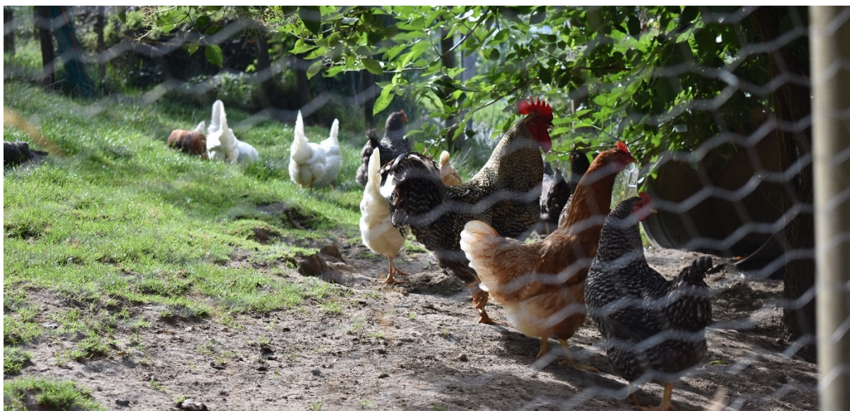
Image 5 : parcours extérieur offrant de l'ombre naturelle, de la terre pour les bains de poussière ainsi que de l'herbe pour explorer et picorer.

Le poulailler doit être éclairé par la lumière du jour et l'intensité d'éclairage minimale ne doit pas être inférieure à 5 lux, mais devrait idéalement être plus élevée, voir art. 33 et 67 OPAn.