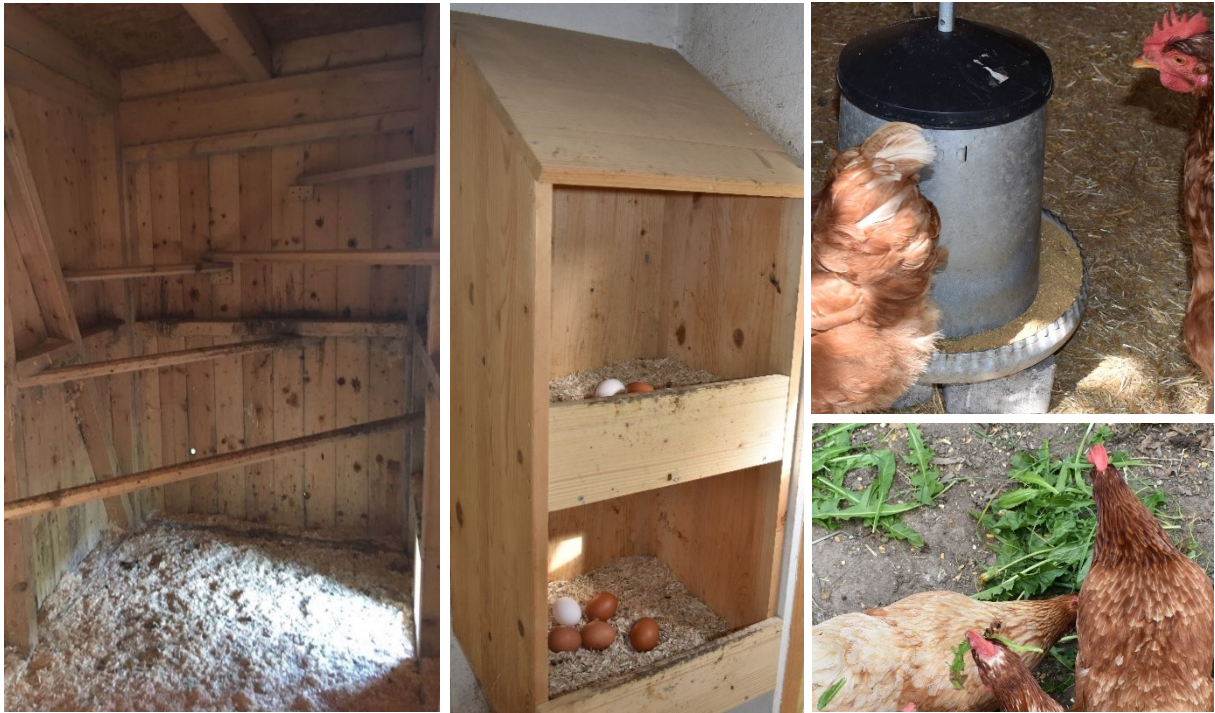
Image 3 : Sur la première photo on voit cinq perchoirs montés à différentes hauteurs. La photo du milieu montre deux pondoirs, fermés sur trois côtés et sur le dessus et pourvus de litière. A droite en haut on voit un exemple de mangeoire circulaire et en bas, des dents-de-lion et des graines données aux poules comme complément.