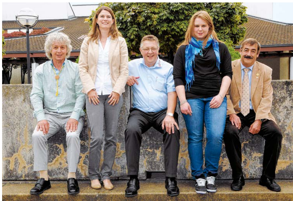
Conférenciers de la journée d'automne 2014