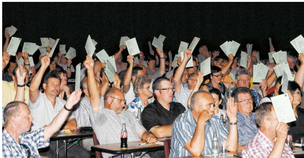
Assemblée des délégués à Martigny.