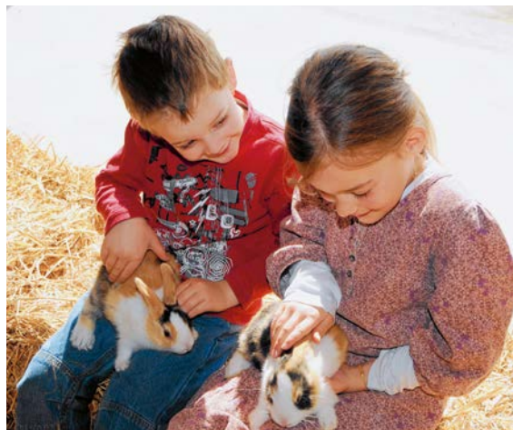
Deux jeunes à l'exposition de jeunes sujets.

Le matériel pour l'adaptation des boxes est financé par Lapins de race Suisse. La commission pour la santé et la protection des animaux a tenté avec d'autres organisations en vain d'empêcher l'entrée en vigueur de l'ordonnance peu compréhensive pour la pratique de l'élevage. Elle est entrée en vigueur dès le 1. 1. 2015. Il faut réunir toutes les forces pour éviter de devoir sans cesse franchir de nouveaux obstacles.