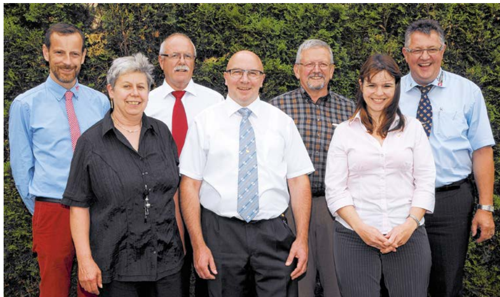
Comité Lapins de race Suisse

L'exposition suisse de lapins mâles 15 a exigé un surplus de travail de la part des membres du comité. Nous nous sommes préoccupés des nouvelles directives concernant les expositions. Deux règlements ont été mis en consultation et seront soumis à approbation à l'AD de Zofingue. Mais nous sommes toujours