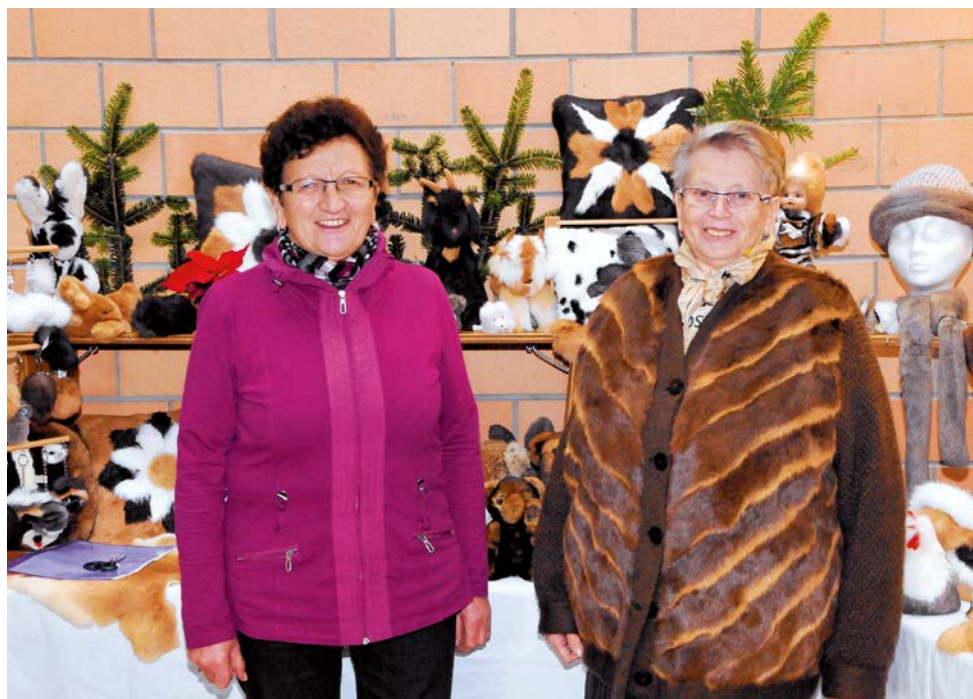
Présentation d'un groupe de Couture sur peaux.