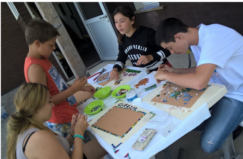
... et bavardage en allemand et en français...